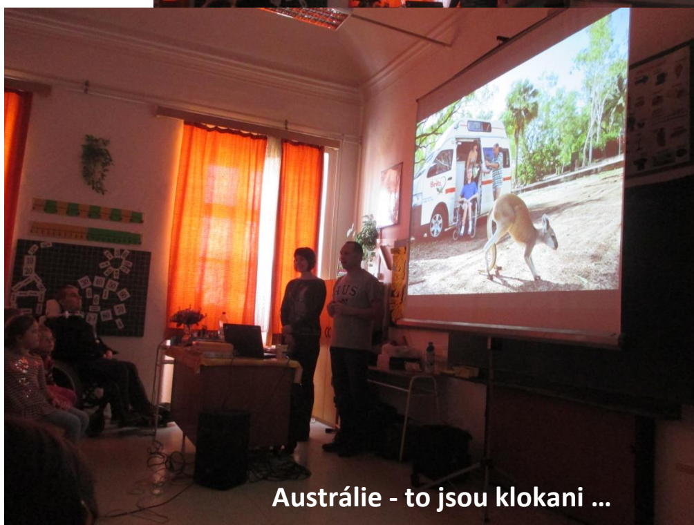
Austrálie - to jsou klokani ...